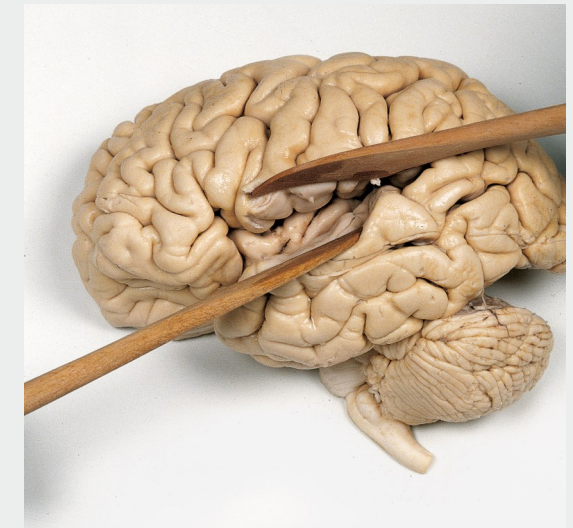
Mit Präparation am humanen Gehirn!

Universitätsmedizin Rostock rechtsfähige Teilkörperschaft der Universität Rostock Institut für Anatomie Gertrudenstraße 9 · 18057 Rostock www.anatomie.med.uni-rostock.de